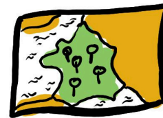
↳ Cartographie participative des fours anciens (cf. lien sur le CR)